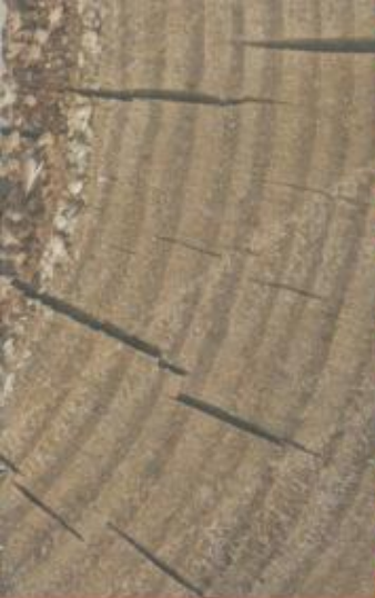
Vollholz Legno massiccio