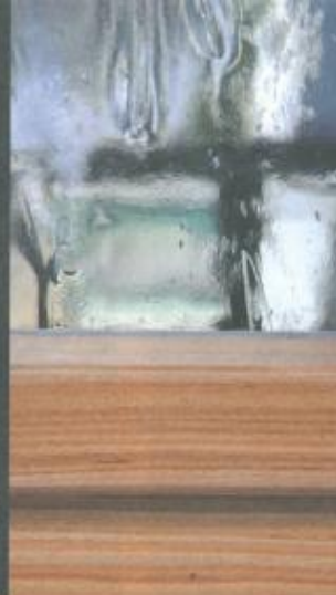
Glaseinsatz Inserimento vetro