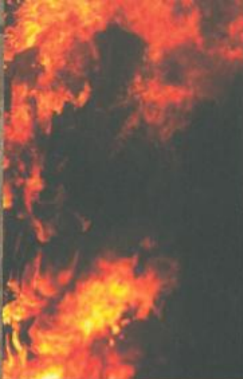
Wärmeisolierung isolamento termico